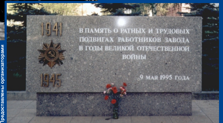
Этот памятный знак открыли к 50-летию великой Победы.

Авиадвигатели семейства М-105/ВК-108 в годы войны устанавливали на самые массовые истребители и бомбардировщики. Конструкция М-105 позволяла устанавливать на «яки» пушки калибром 45 и 57 миллиметров, что на порядок увеличивало их огневую мощь.