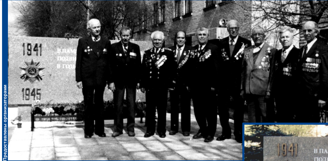
Они сражались за Родину, защищали Ленинград.

...Еще до начала страшной войны главным направлением основанного в 1891 году предприятия стала оборонная продукция. Здесь делали узлы и агрегаты для первых отечественных танков, производили броневые противотанковые снаряды. Руководители страны понимали: война не за горами. В сентябре 1939-го Совет Народных Комиссаров принял программу перевооружения Военно-воздушных сил, и вскоре завод перевели в только что созданный наркомат авиационной промышленности. Частично поменялась и специализация.